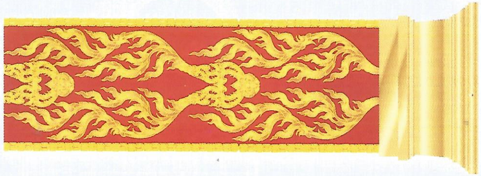
เสา จำนวน 4 ชุด